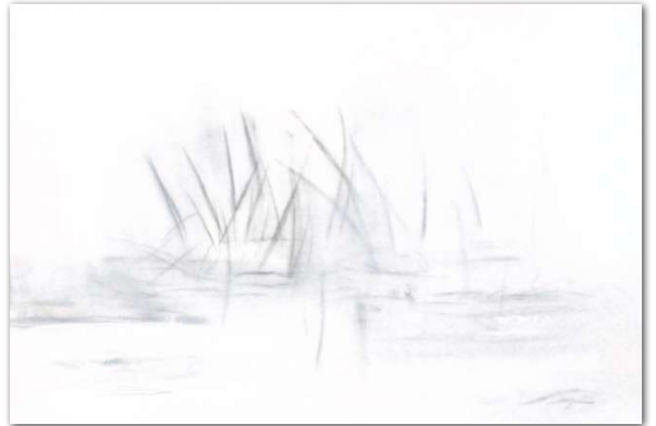
Schilf im Wasser 80 cm x 120 cm Acryl/Kohle · 2007