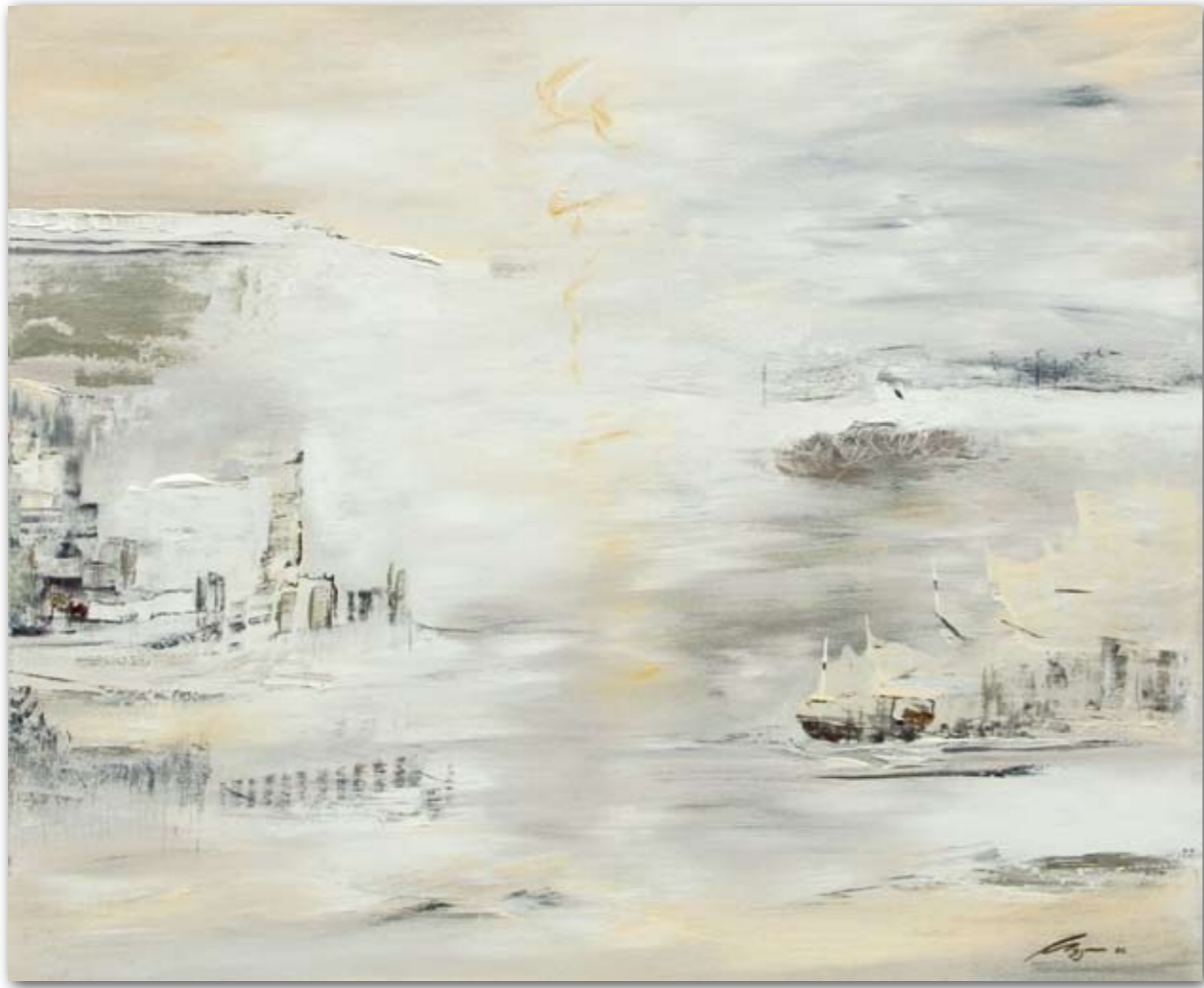
Sehnsucht 100 cm x 120 cm Acryl · 2006