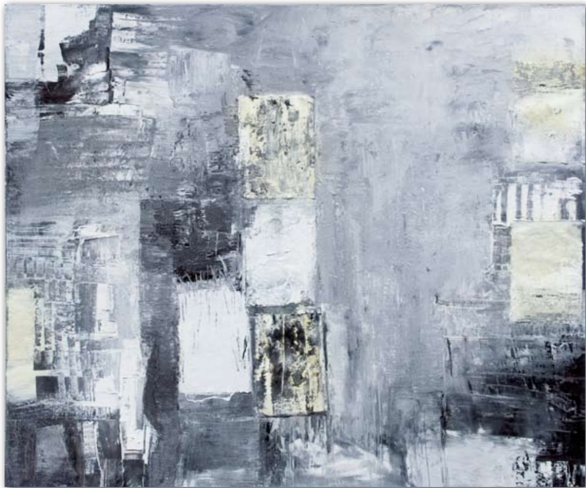
Graue Fassade 80 cm x 100 cm Öl gespachtelt · 2007