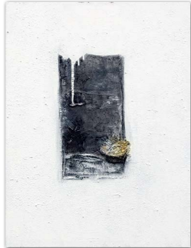
Goldrausch 60 cm x 80 cm Acryl/Sand · 2007