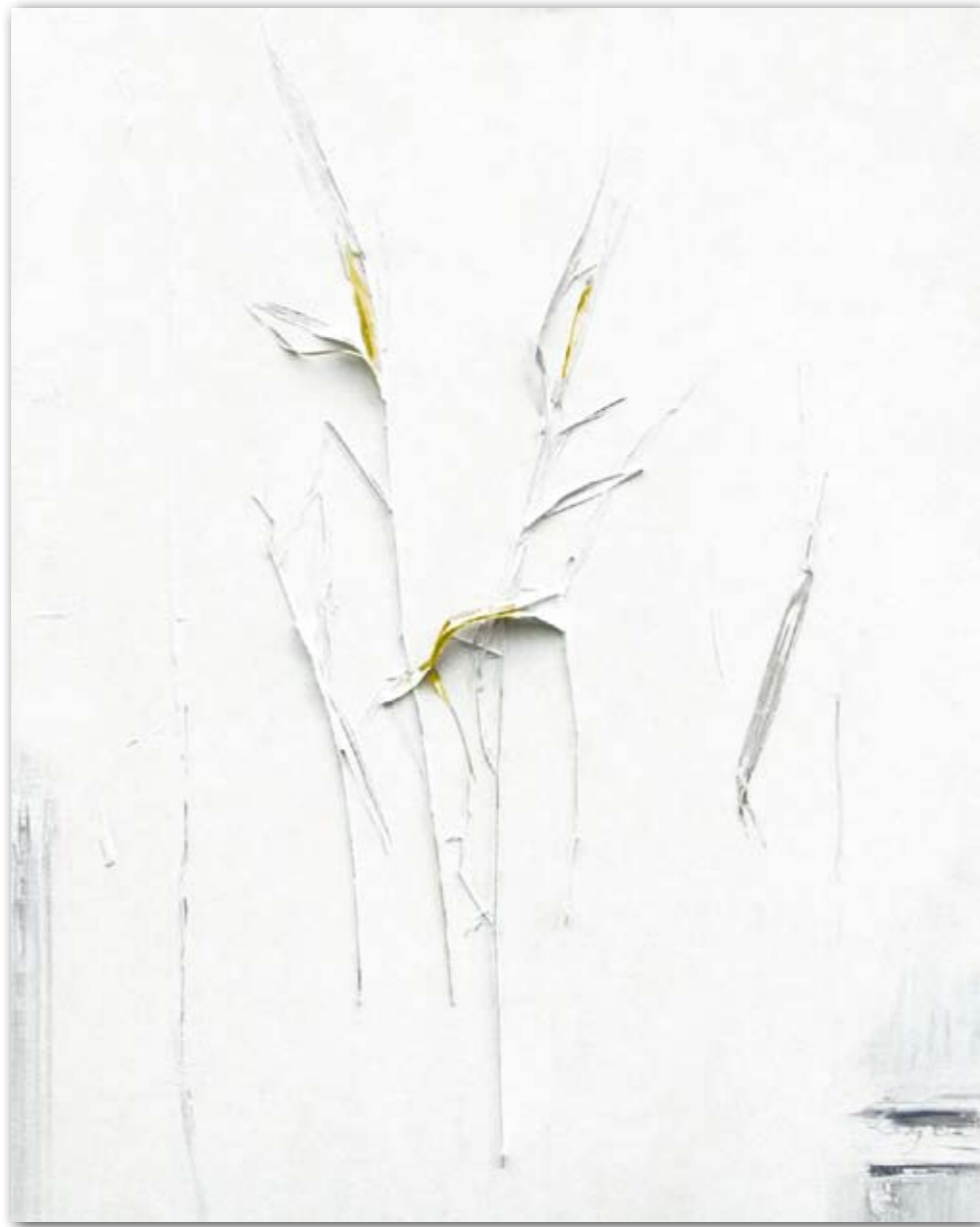
Findling aus Prüm 80 cm x 100 cm Acryl · 2006