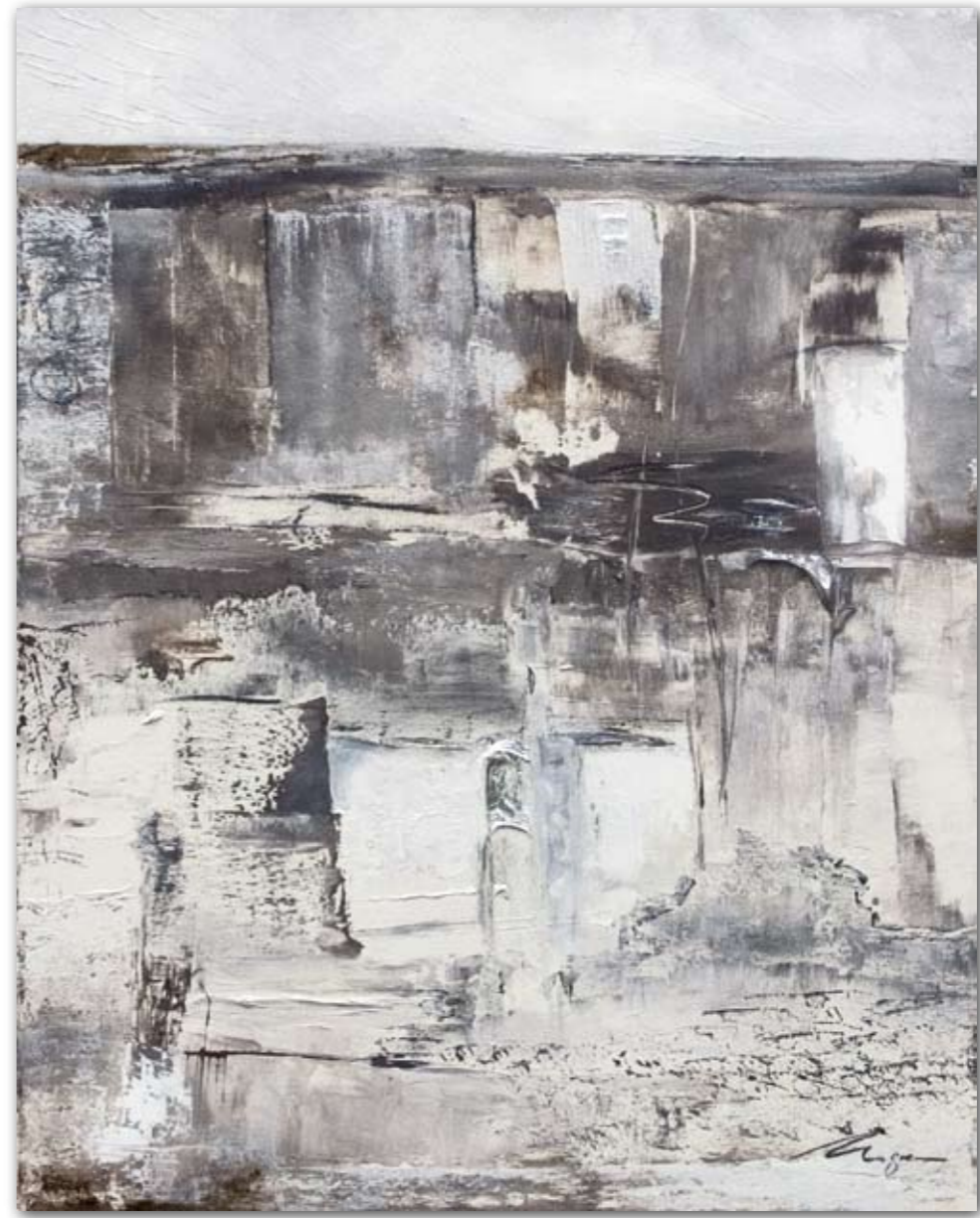
Asphalt 80 cm x 100 cm Acryl/Spachtelmasse · 2007