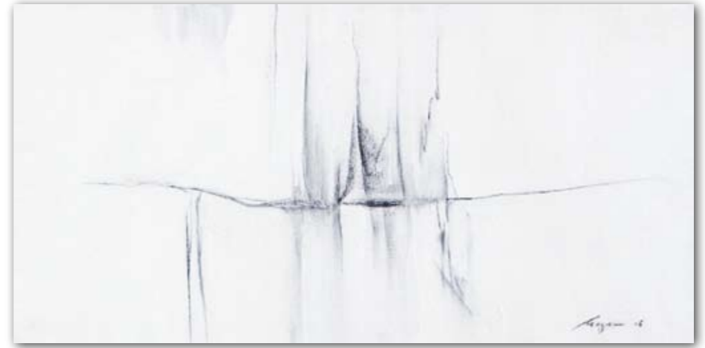
Leichtigkeit 1 40 cm x 80 cm Acryl · 2006