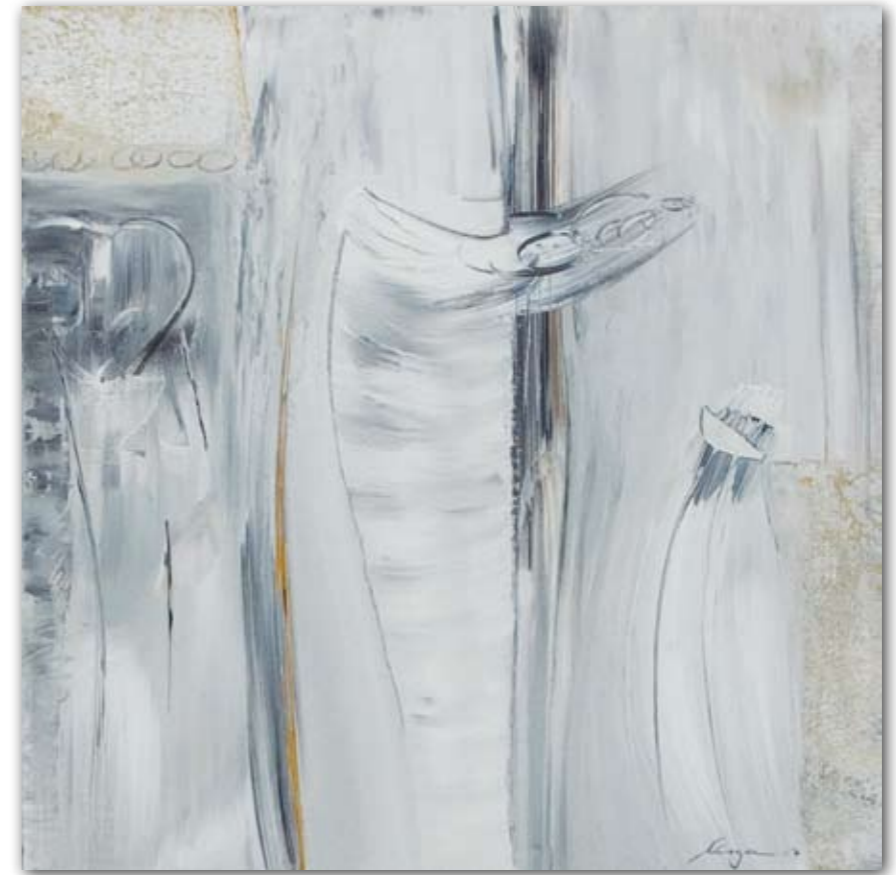
Stilleben 60 cm x 60 cm Acryl · 2007