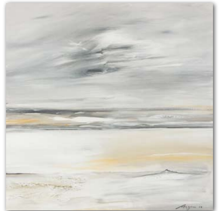
Meer 60 cm x 60 cm Acryl · 2007