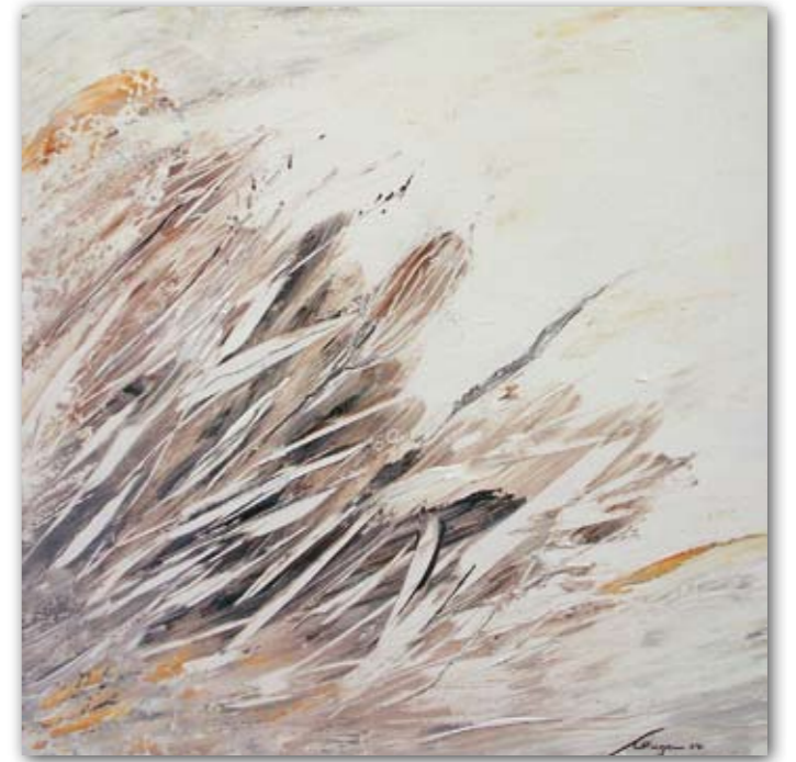
Wildgräser 60 cm x 60 cm Acryl · 2007