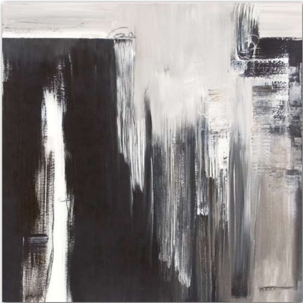
Abgestimmt 2 (ruhend und tonlos) 80 cm x 80 cm Acryl · 2007