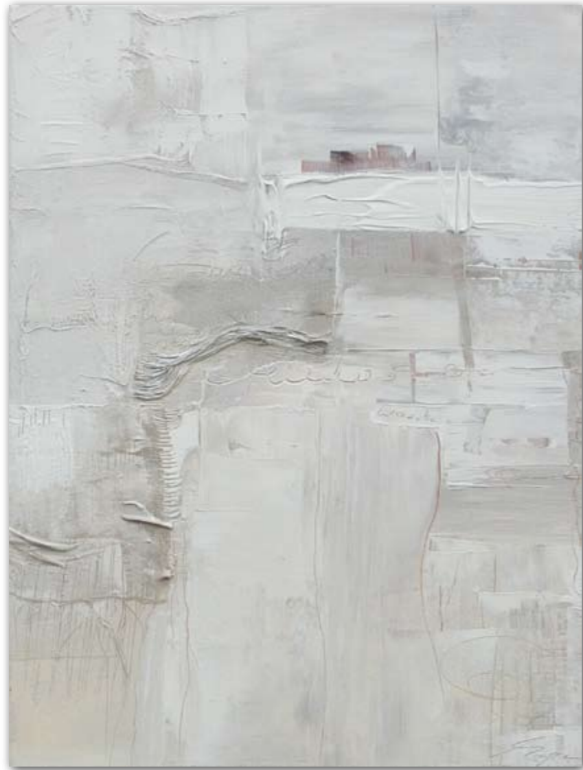
Miteinander verknüpft 60 cm x 80 cm Acryl · 2006