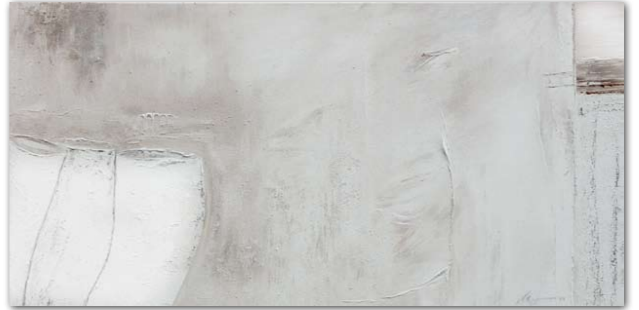
Stilleben 60 cm x 120 cm Acryl/Sand · 2007