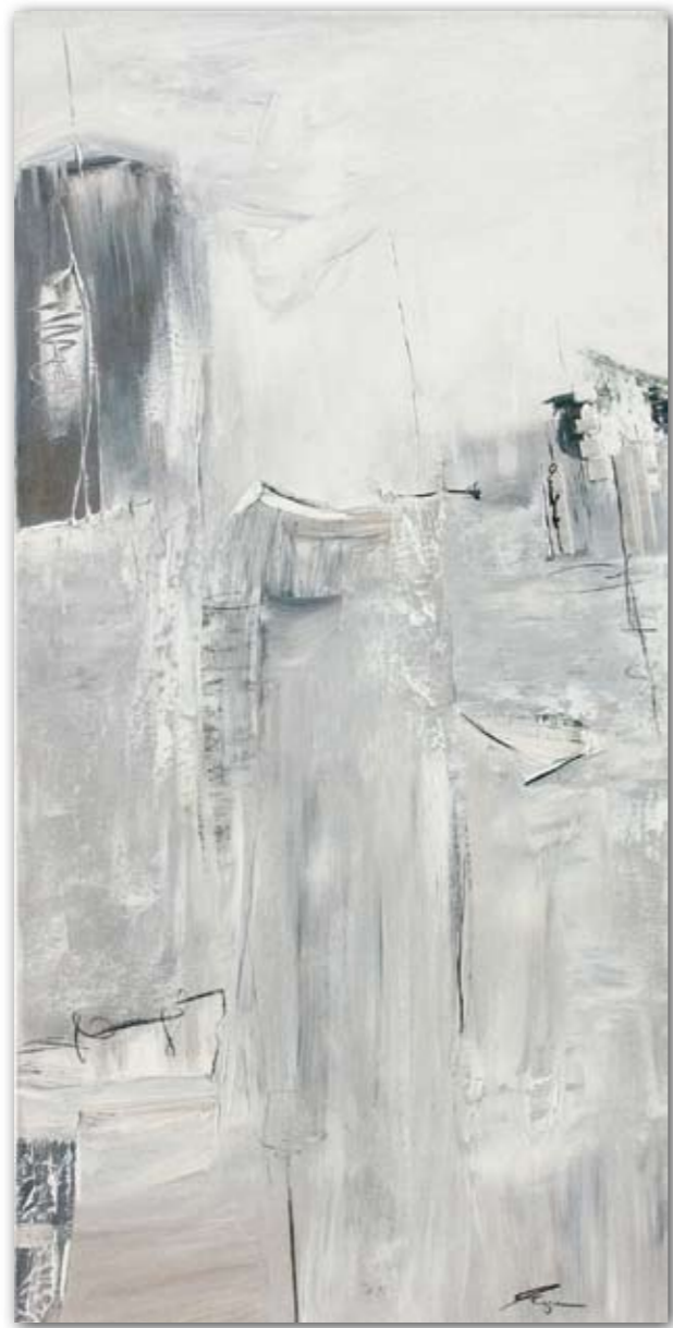
Zarte Bewegung 60 cm x 120 cm Acryl · 2006