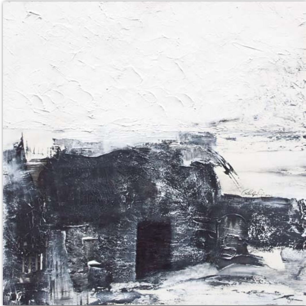
Reifeprüfung 100 cm x 100 cm Acryl · 2006