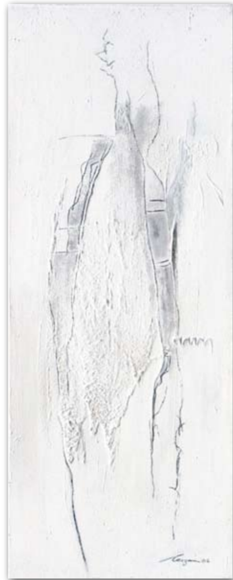
gebunden und gefestigt 40 cm x 100 cm Acryl · 2006