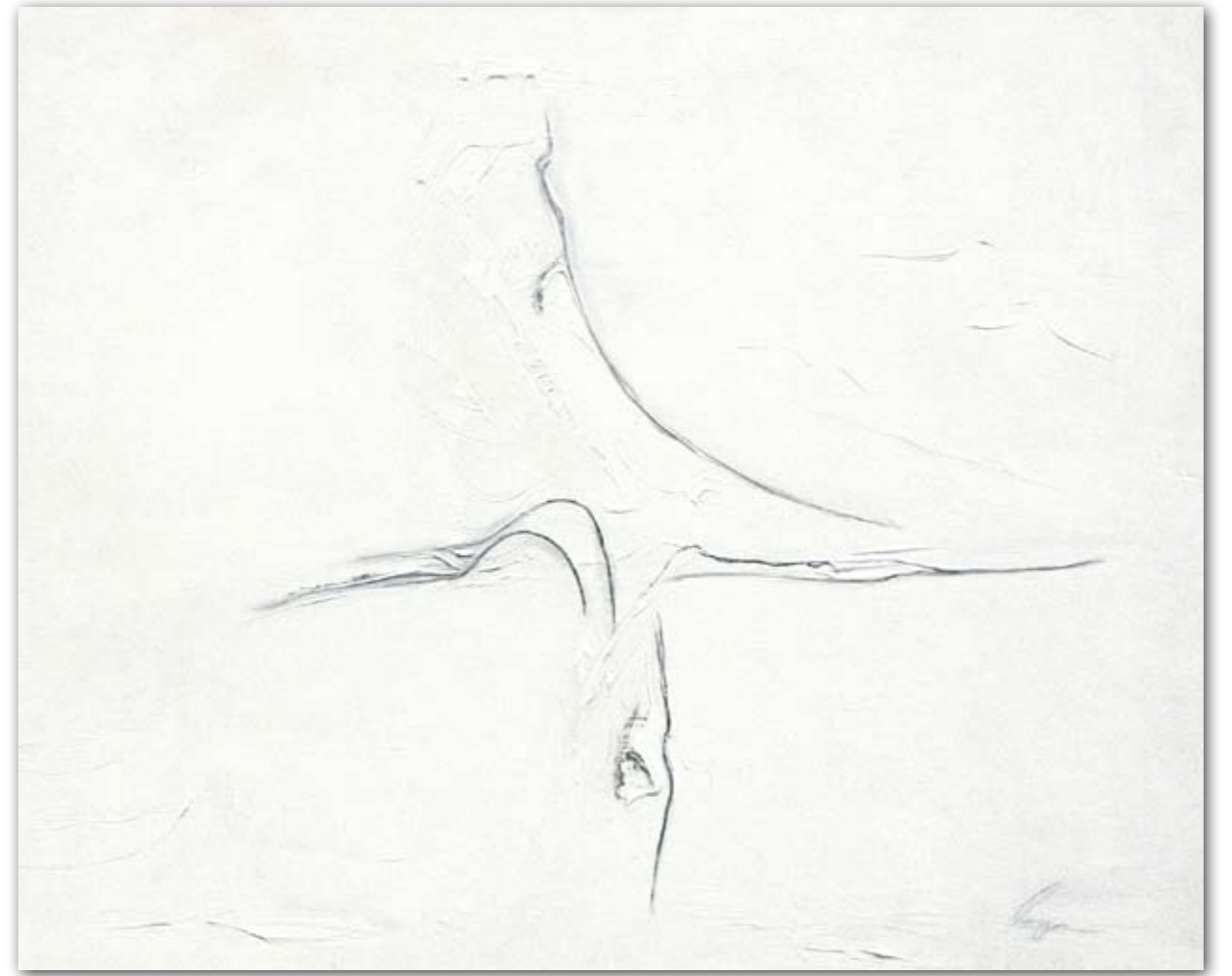
Ultraleicht 100 cm x 80 cm Acryl · 2007