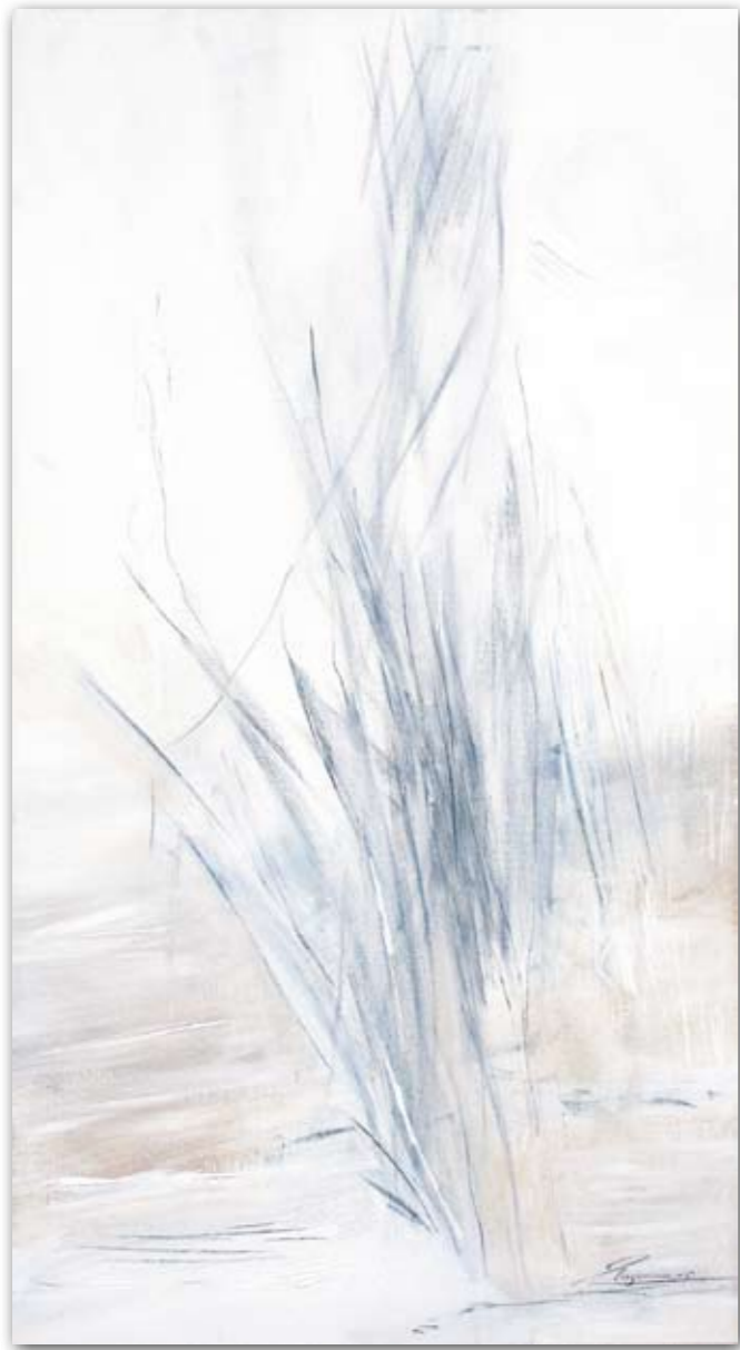
Gräser 60 cm x 120 cm Acryl · 2005