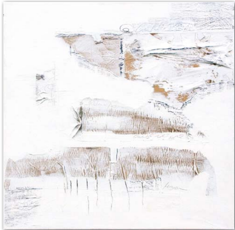
Gut verpackt 80 cm x 80 cm Acryl/Kohle · 2007