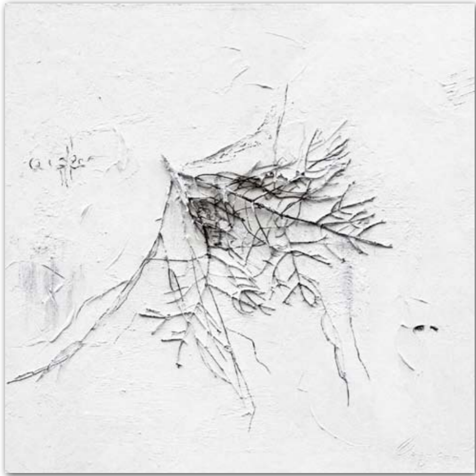
Tanne im Schnee 80 cm x 80 cm Acryl · 2007