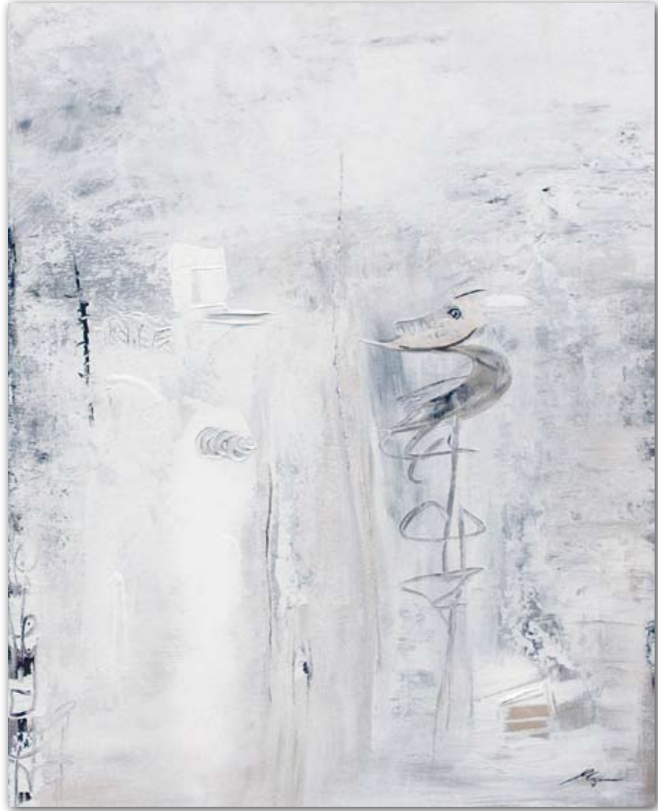
Skulptur 80cmx100cm Acryl · 2007