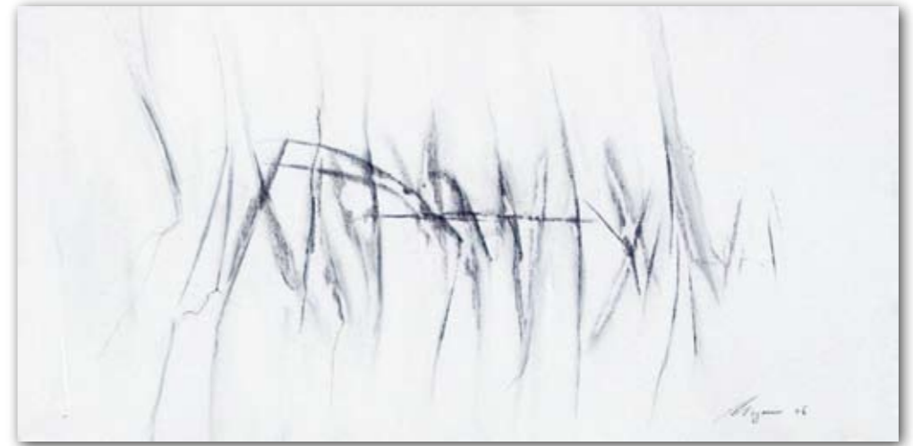
Leichtigkeit 2 40 cm x 80 cm Acryl · 2006